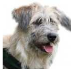
Auf diesem Foto siehst Du übrigens „Uschi“, ein ehemaliges „Not-Fell“ und Pflegetier der Glückspfoten